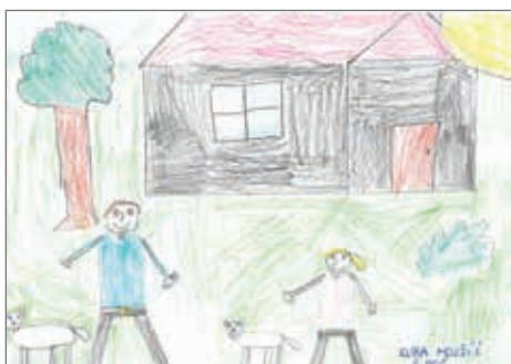
Jakub Mojžíš, 3. ročník