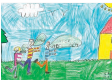
Michal Málek, 4. ročník