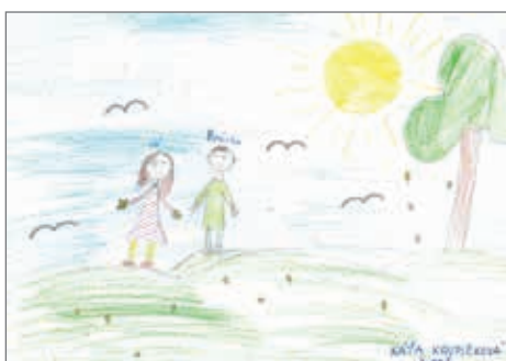
Kateřina Krupičková, 3. ročník