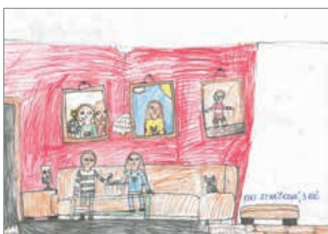
Kristýna Sykáčková, 3. ročník