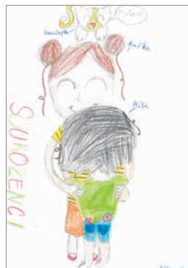
Michaela Diblíková, 4. ročník