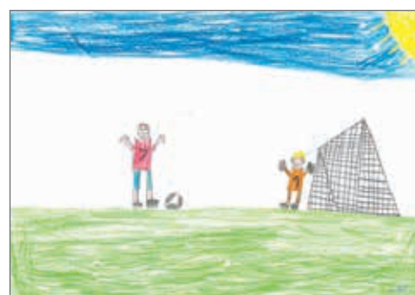
Tomáš Šlechta, 4. ročník