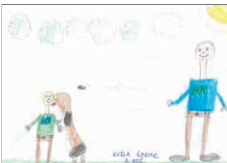
Jakub Šprinc, 3. ročník