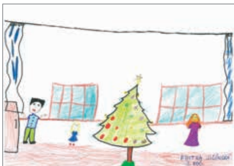
Edita Jičínská, 3. ročník

„ Moje nejoblíbenější sportovní aktivita “. Své výtvary a nápady zasílejte na email: zpravodaj@obecsrch.cz nebo afejfarova@email.cz . Své příspěvky pošlete do 31. 3. 2020. -af-