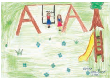
Eliška Jedličková, 3. ročník