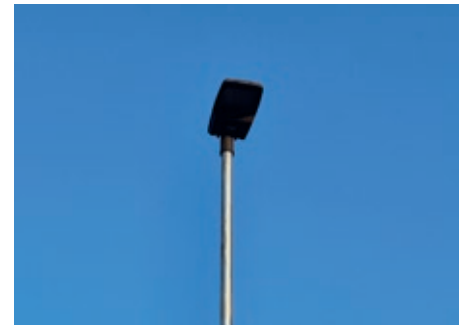
Výměna uličních svítidel

Nyní běží příprava projektové dokumentace, následně bude požádáno