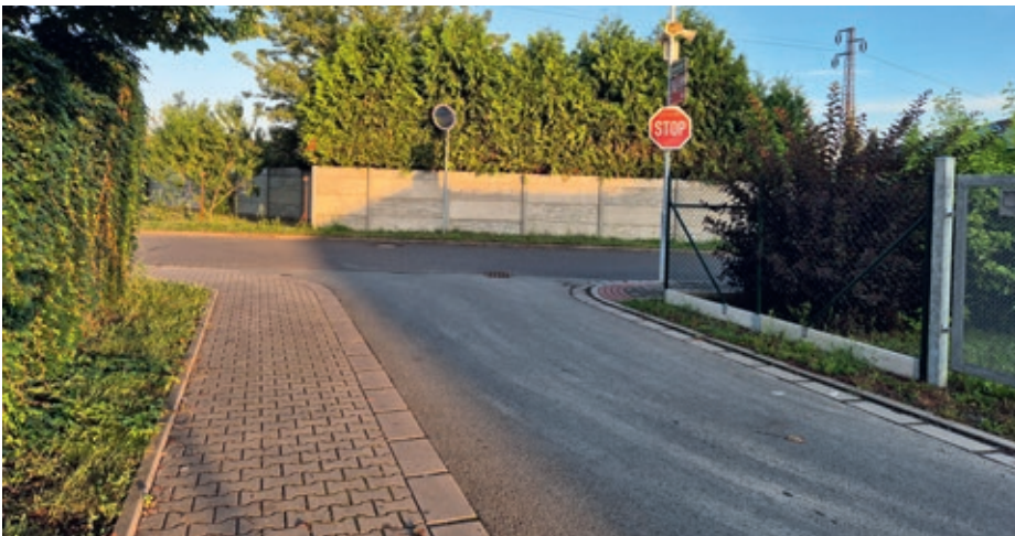
Lokalita u hřiště

V rámci zvyšování bezpečnosti dopravy v našich obcích bude vybudována zvýšená křižovatka při výjezdu ze sportovního areálu do ulice U Hřiště. V místě se pohybuje velké množství dětí, v minulosti na této křižovatce došlo k vážné dopravní nehodě. Dále bude v celé lokalitě umístěno nové vodorovné a svislé dopravní značení Tempo 30 s předností zprava.