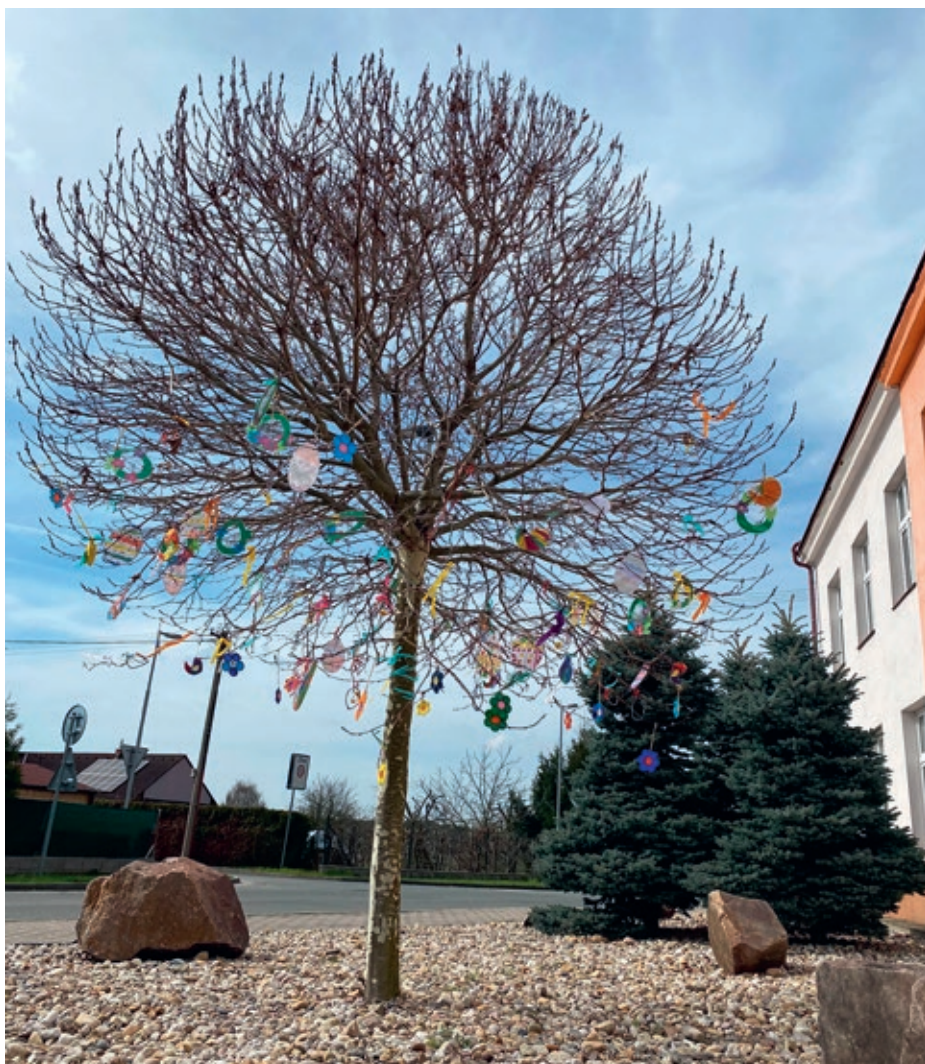
Velikonoční strom