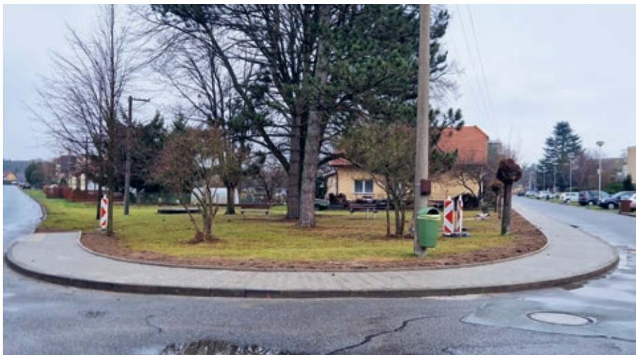
Chodník Na Výsluní

Dokončeno do 20. 12. 2023. Nový chodník zvýší bezpečnost chodců pohy-