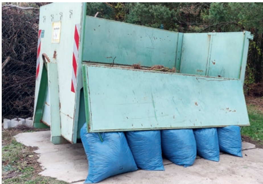
Jak NElikvidovat odpad

Likvidace jedné tuny směsného komunálního odpadu stojí 1 900 Kč, likvidace jedné tuny vytríděného bio odpadu 780 Kč a likvidace jedné tuny papíru je zdarma. Pokud však objem směsného komunálního odpadu přesáhne 170 kg na občana, cena za likvidaci směsného komunálního odpadu se dle zákona