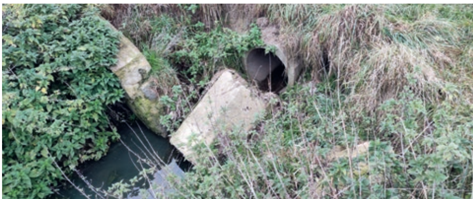
Propustek před opravou