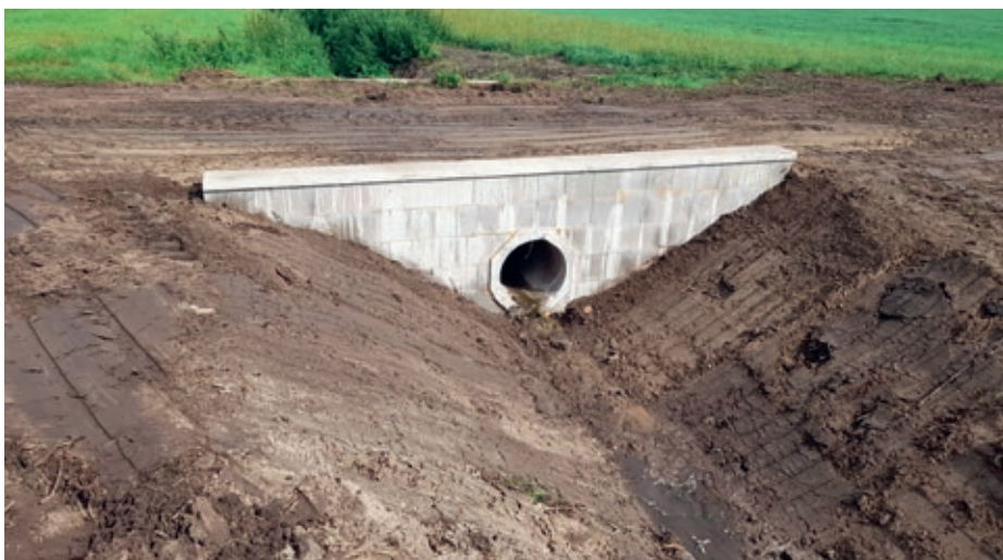
Propustek po opravě